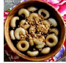
豬籠板 zhu nung ban