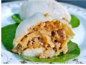
牛汶水 ngiu vun shui