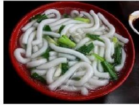
米篩目 mi si mug